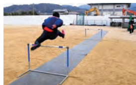
インターバルの感覚を 養う練習