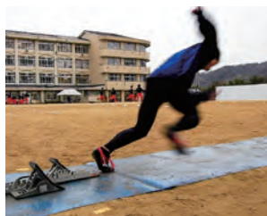
スタートダッシュの 集中トレーニング