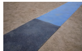
敷くだけで設置完了 敷き方の工夫で高跳びにも使用できます