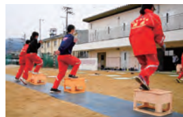
本格練習前の ウォーミングアップにも