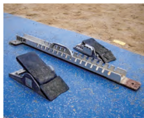
別売の競技用器具も ご使用いただけます ※使用いただけない器具もございます