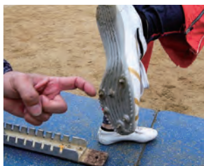
トラックピンスパイクで 走る感覚をトレーニング