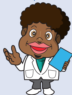
当社マスコット 「ゴムっち」