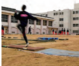
踏切までの 助走イメージ練習