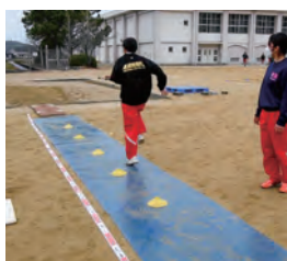
踏切タイミングの 集中練習