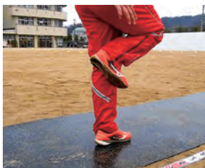
反発を捉える練習に