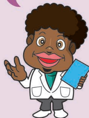
当社マスコット 「ゴムっち」